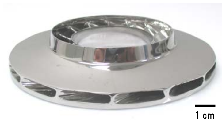
図 2: 試作造形に成功した複雑な形状を有する羽根車