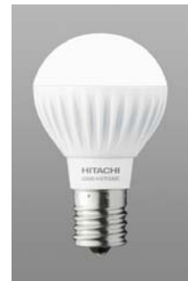
[図 2 LDA7L-H-E17/S/60C]

一般的にLED電球を明るくする場合、発熱量が増加するため、その対策が開発上の課題となります。そこで本製品では、LEDモジュールの温度上昇を抑えるため、LEDモジュールを配置する光源基板を大型化し、LEDから発生する熱を分散させることで、光源基板の放熱性を向上させました。さらに、高効率LEDモジュールやヒートシンクにアルミ基板から出た熱を効果的に放熱する放熱性能の高い新開発のボディ構造の採用によりアルミボディの直径を40mmに大型化し、光源基板とアルミボディの接触面積を拡大しつつ、放熱に必要な表面積を確保しました。これらの取り組みにより放熱構造を最適化することで、電球色60W形相当を製品化することができました。