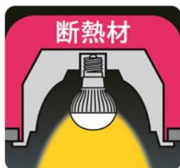
[図 3 断熱材施工器具装着イメージ図]

新製品 6 機種は、器具内の温度や周囲温度が高くなると自動的に電力を抑え、LED 電球の温度上昇を抑制する保護回路を採用しました。これにより、断熱材施工器具や密閉形器具にも対応可能です(図 3)(図 4)。