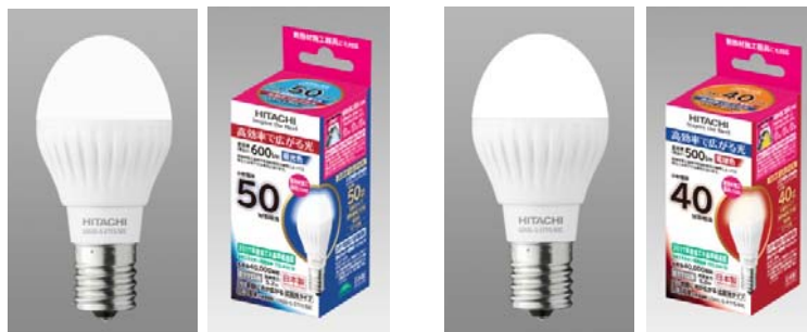
広配光タイプ 小形電球 50W 形相当 LDA5D-G-E17/S/50C(昼光色)