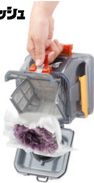
【図2 ごみ捨て簡単「ごみダッシュ」】