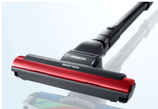
【図1 新開発スマートヘッド】

従来は、ヘッドを押したときは前からごみを吸いやすく、引いたときはヘッド後部にある固定ハケにごみが押されて、取れずに残ることがありました。新開発「スマートヘッド」はヘッド内部の構造を見直すとともに、ヘッド後部に回転ハケを採用することで、ヘッド