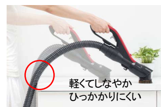
【図5 スマートホース】

ができる「クルッとヘッド」や、ヘッドが浮かずに家具の下の奥まで掃除ができる「ペタリンコ構造」、腰をかかめず片手でパイプの長さを調節できる「サツとズームパイプ」、ごみ捨てが簡単な「ごみダッシュ」機構など様々な独自機能を開発し、操作性を向上してきました。今回の「スマートヘッド」でさらに使いやすく、掃除がラクに行えます。