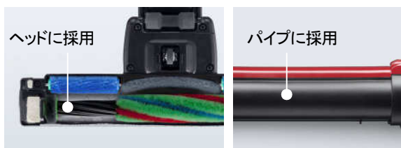
【図4 カーボン繊維強化プラスチック採用のヘッドとパイプ】

これまでも当社では、実際の掃除動作における使いやすさにこだわり、壁際やすき間もスムーズに掃除