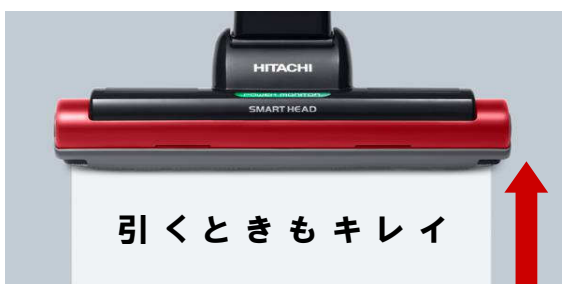
【図2 引いたときも吸込む】