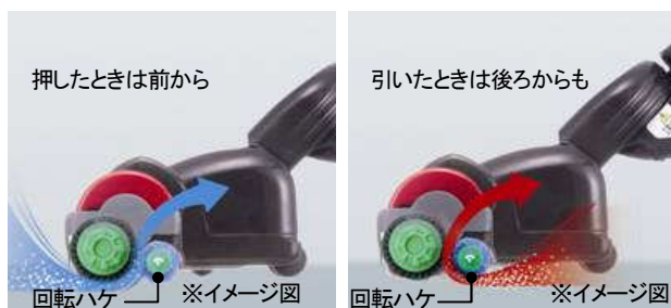
【図3 ダブル吸引機構】

を引いたときもごみを巻き込みながら吸い込むことが可能になります。押したとき・引いたとき(図 2)の両方とも効率よくごみを吸い込む「ダブル吸引機構」(図 3)で、素早くラクに掃除が行えます。また、掃除のしやすさを重視したワイドなヘッド幅 30cm はそのままにスリムな新形状デザインで、ヘッドの底面積や質量 (*) を低減することにより、操作性も向上しています。