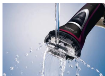
【図 5 水洗いイメージ】