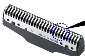
【図 1 ウェーブキャッチ刃】

本製品は、内刃の刃先最鋭角部を 27 度とし、刃の形状をウェーブ形状にした「ウェーブキャッチ刃」を搭載しました。鋭いウェーブ形状の刃がヒゲをしっかりと捕らえ引いて切ることで、なめらかな切れ味を可能にしました。さらに、内刃面積を約 15%拡大 *1 することにより、効率よくヒゲを捕らえ早剃りも可能となっています。「ウェーブキャッチ刃」は、硬度・靱性に優れた「YSSヤスキハガネ」 *2 を使用しています。