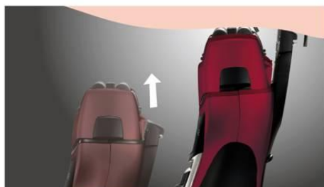
[図6 「コンビネーショントリマー」イメージ]

本製品では、メインの刃と同時にヒゲをカットできる「コンビネーショントリマー」を搭載しています。キワゾリ刃で長いヒゲやくせヒゲを短くし、外刃で仕上げるコンビネーション剃りや、モミアゲなどのキワをそろえるときに使うキワ剃りが可能です。