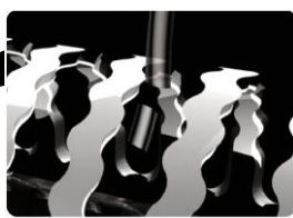
【図 2 刃先のイメージ図】