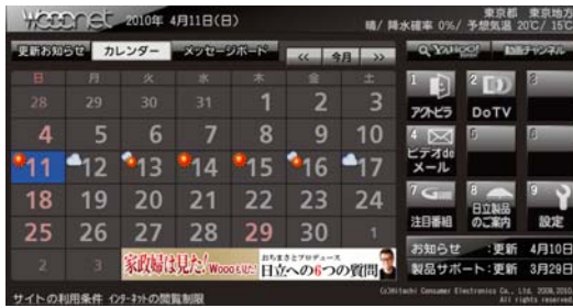
Woonet トップ画面イメージ