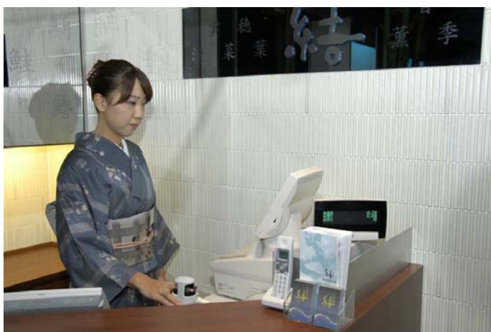
「指静脈認証連携 POS レジ会計システム」

既存の「勤怠管理システム」と指静脈認証システムを連携させたほか、 外食業界で初めて、指静脈認証のみで、POS レジの操作や精算処理を実現