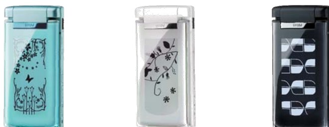
リキッドグリーン クリスタルホワイト グラファイトブラック

株式会社日立製作所(執行役社長:古川 一夫/以下、日立)はこのたび、国内初 (※1) の電子ペーパー (※2) による「シルエットスクリーン」を本体背面部分に搭載し、携帯電話の背面パーツを取り替えることなく背面部分のデザインパターンを変えることができる「W61H」を開発・製品化し、KDDI 株式会社、沖縄セルラー電話株式会社への納入を開始します。