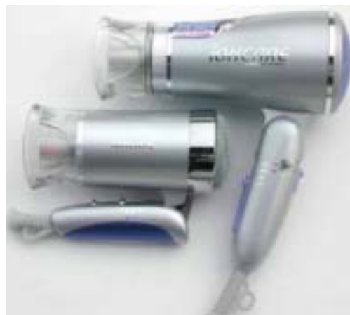
ミニドライヤー（左）と従来品のサイズ比較