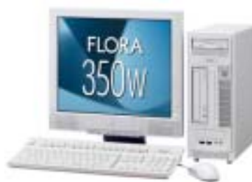
FLORA 350W (PC8DE4/DE5)

日立製作所 コピキタプラットフォームグループ（グループ長&CEO：百瀬次生）はこのたび、基本性能の向上とネットワーク機能を強化した、企業向けA4オールインワンノートPC「FLORA 270W」およびスリムタワーPC「FLORA 350W」の新モデルを11月27日から順次発売します。