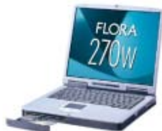
FLORA 270W (PC8NB1/NB2)