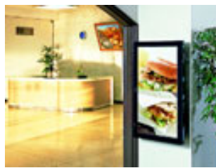
店舗入口 (商品 PR)