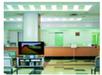
公共スペース (地域情報)