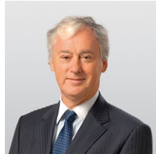
スティーブン・ゴマソール