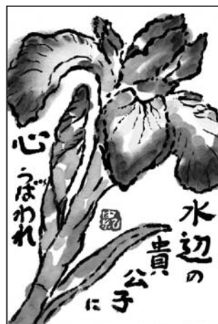
「あやめ」 糸井 由紀子 作