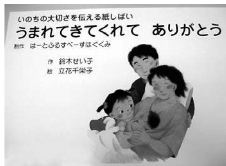
「寄贈された紙芝居」

きていくことではなく、生きているだけで百点満点」という先生の熱い思いが伝わり、参加された方々は感銘を受けてお