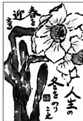
「スイセン」 糸井 由紀子 作