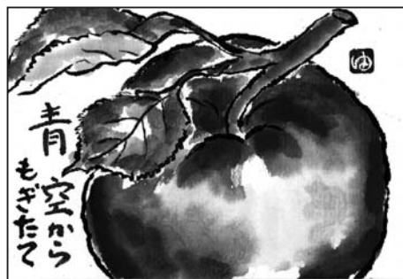
「りんご」 糸井 由紀子 作