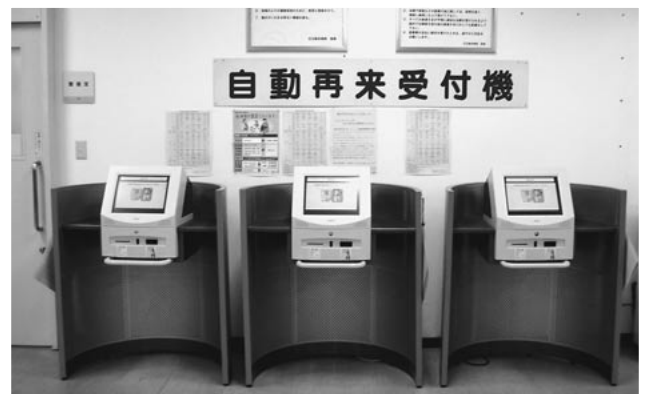
バリアフリータイプの新自動再来受付機

本体は車椅子の患者さまのご利用を配慮したバリアフリータイプを採用し、画面もよりスムーズに操作できるように変更しました。また病院の診療時間終了後は本機器を使用して当院のホームページがご覧いただけます(ホームページは画面に指をふれるだけで操作できます)どうぞご利用ください。