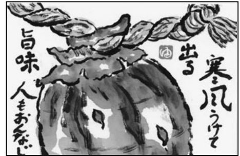
「干し柿」 糸井 由紀子 作