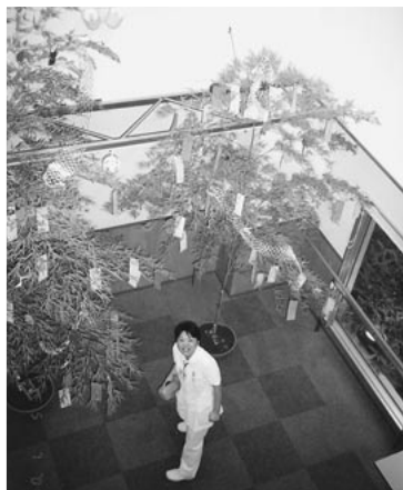
エントランスの笹飾り