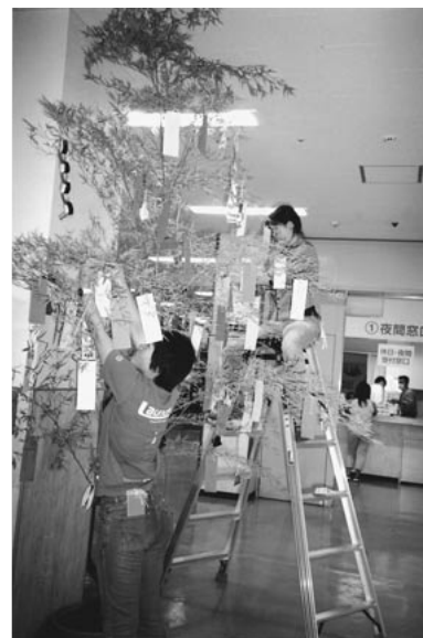
飾りつけのようす