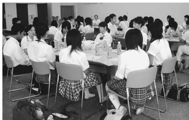
グループワークのようす