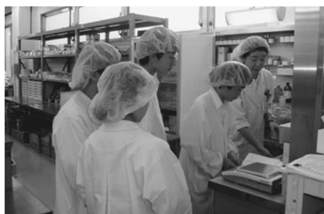
薬局での体験学習のようす