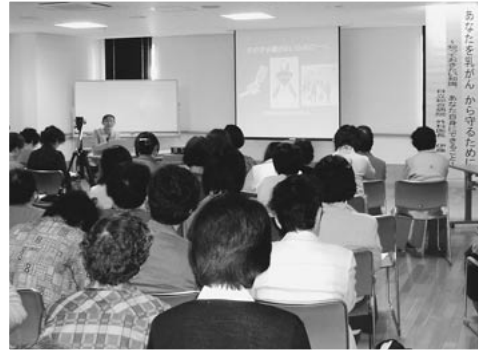
熱心に受講された参加者