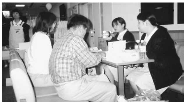
大好評の計測と健康相談のコーナー

5月14日(土)午前10時～午後2時、がんセンター1階の外來待合室を主な会場とし「看護の日」のイベントを開催しました。このイベントは、5月12日のナチンゲールの生誕を記念し制定されている「看護の日」にちなんで毎年行っているものです。当日は晴天に恵まれ561名もの方々にご来院いただきました。