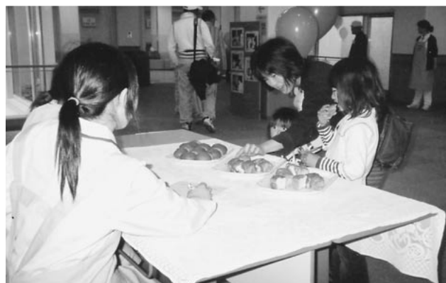
病院で提供している焼きたてパンの試食

今年は、『ふれあい看護体験2005「看護の心をみんなの心に」』をテーマに毎年好評の計測と健康相談・白衣の試着・バザー、さわやかコンサート等のアトラクションを企画し来院された方々に楽しんでいただきました。