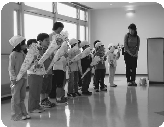
二葉幼稚園の園児たち