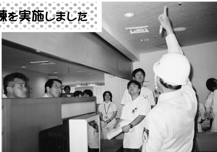
防火設備について説明を受ける職員たち

万一の災害・火災などの発生に備え、参加者は操作方法の取得のため熱心に聞き入っていました。