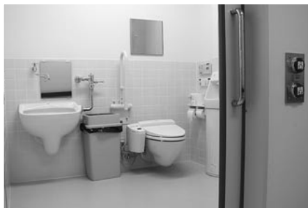
内視鏡室脇のトイレ