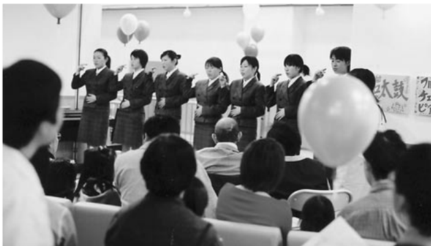
学生による手話コーラス

5月10日(土)に「看護の日」のイベントを開催しました。当日は晴天に恵まれ昨年を上回る約600名もの方々にご来院いただきました。今年ががんセンター1階の外来待合室を主な会場とし、毎回好評の身長・体重・体脂肪・血圧などの計測と健康相談・白衣の試着・バザーなどを行いました。また午後からは、新企画の「さわやかコンサート」を実施し、日立看護専門学校 1 の学生による手話コーラス、おおぞら学童クラブによる和太鼓、当院医師によるフルート・チェロ・ピアノ三重奏を楽しんでいただきました。もりだくさん