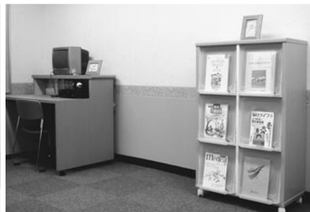
ビデオは20巻あります