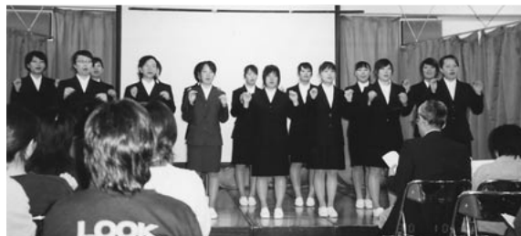
手話同好会の発表