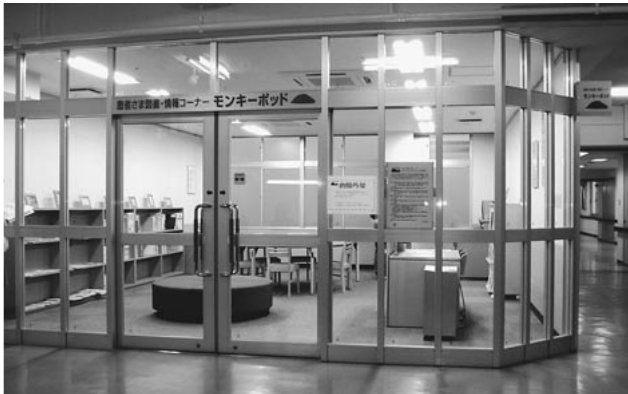
モンキーポッド正面