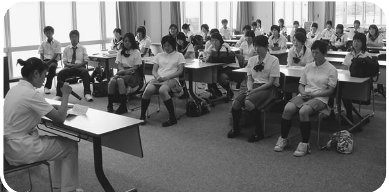
看護師の話に耳を傾ける高校生

7月22日(木)と29日(木)に行われた高校生の「一日看護体験」では、2日間で89名(内16名男性)が参加し、看護師