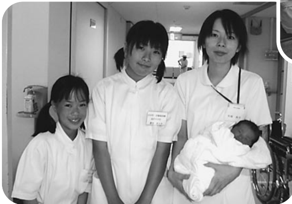
C棟4階にて学習中の中学生

白衣の試着や看護師長を囲んでの懇談会のなかで、「看護師は、大変だけれどやりがいのある仕事なのでぜひ挑戦したい」などの感想をいただきました。