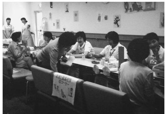
好評だった計測と相談のコーナー

内容は、計測と健康相談、病院ウォッチング・さわやかコンサートです。コンサートは、手話コーラス・和太鼓・ハーモニカ演奏・合唱・3重奏と2時間にわたり楽しんでいただきました。