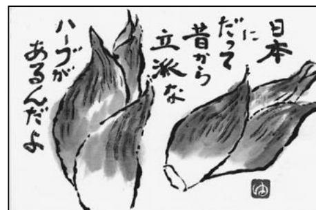
「みょうが」作 糸井 由紀子