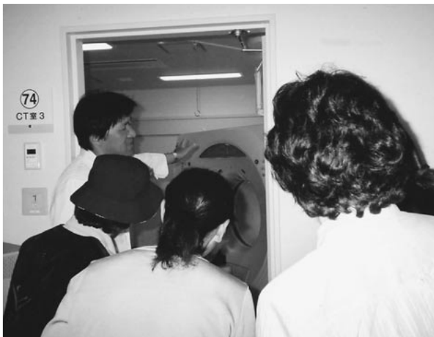
病院ウォッチングで院内をご案内しました

5月15日(土)に看護の日のイベントを開催し、235名の方に参加していただきました。