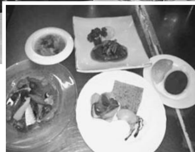
低カロリー コース料理