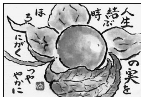
「ほおずき」作 糸井 由紀子