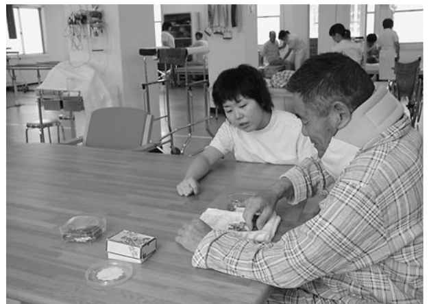
リハビリ室にて(作業療法のようす)

リハビリテーション科では、昭和49年から理学療法(下肢機能、基本動作の回復)、昭和58年から言語療法(意思疎通の回復)がすでに開設されており、今回作業療法(上肢機能、応用動作の回復)がそろうて、三位一体であり総合的なリハビリが可能になりました。今後は更に充実したリハビリテーション医療を患者さまに提供できるよう推進します。