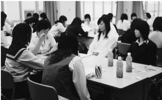
看護師長を囲んで(高校生)

7月10日(木)と18日(金)に行なわれた高校生の「1日看護体験」では2日間で96名(内2名男性)が参加し、看護師の役割の説明を受け、病棟で見学・実習をしました。