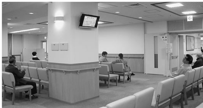
院内11ヶ所に設置しております

ご来院される皆さま方に当院への理解を深めていただけるよう、今後ますます内容を充実させ、多くの情報を提供していきたいと考えております。