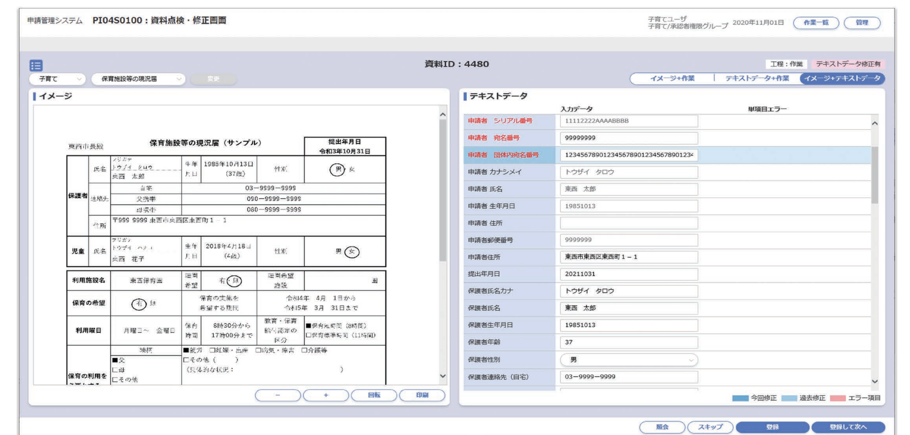
申請管理システムの資料点検・修正画面イメージ